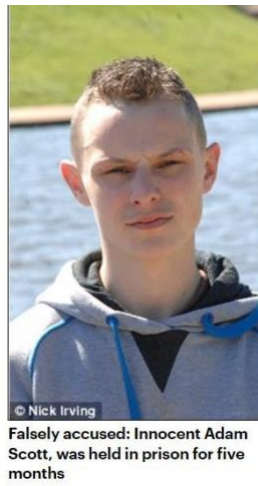
Gráfico No.1 Falsa acusación a Adam Scott

Fuente: Daily Mail, 1 de octubre de 2012 5